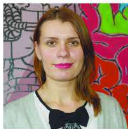
Ірина Білик Iryna Bilyk