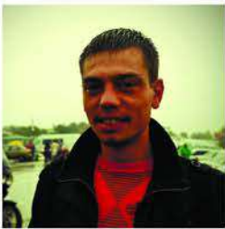
Дмитро Зінченко Dmitry Zinchenko