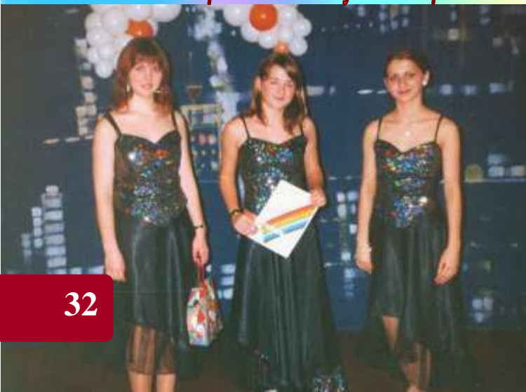
Команда Корсунщини "Лідер", 2000р.