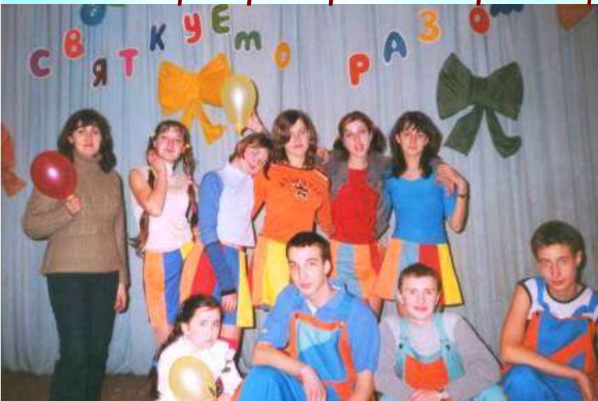
Гра-випробування "Котигорошко". Команда Корсуня.