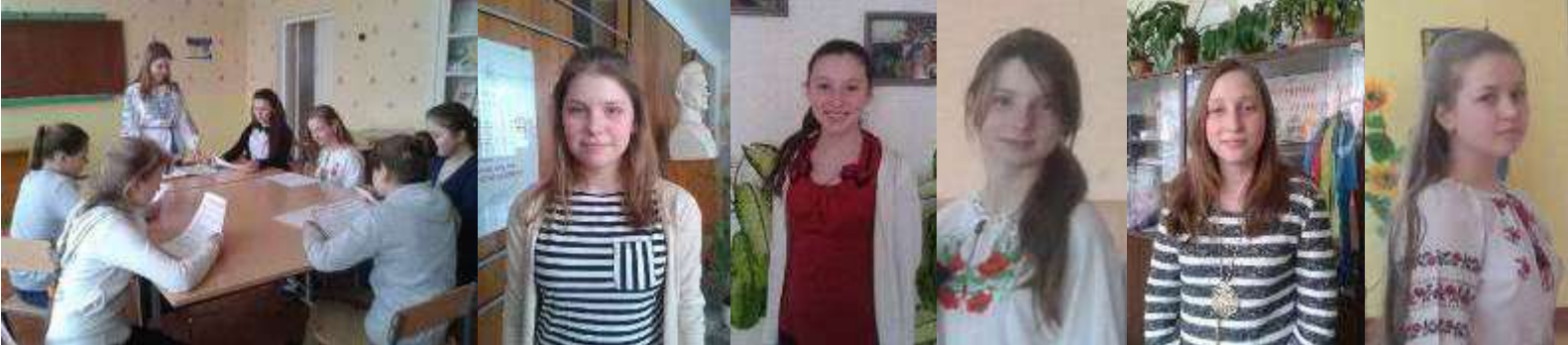
Рада Великого Товариства