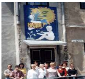
Команда товариства 1997 р

Як паморозь ранкова на траві, сивіють матері з роками. Мов хрест з покутою несуть, той вирок - що дитя неповносправне. Не бачать очі, але ясний розум, не ходять ніжки - та життя триває. Ми хочем жити, ми такі як ви! Чому ж обмеженням кінця немає? Приймайте нас такими, як ми є, жалю і сліз вже вкрай у нашій долі. Неповносправність - не могильний хрест! Любові до життя у нас